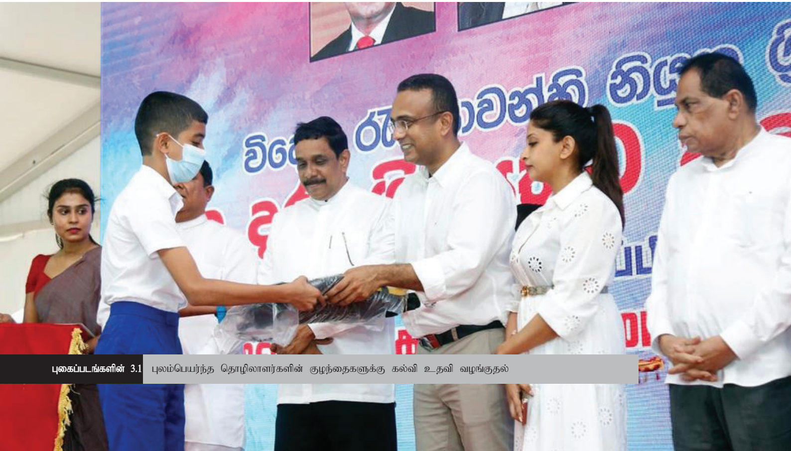
புகைப்படங்களின் 3.1 புலம்பெயர்ந்த தொழிலாளர்களின் குழந்தைகளுக்கு கல்வி உதவி வழங்குதல்