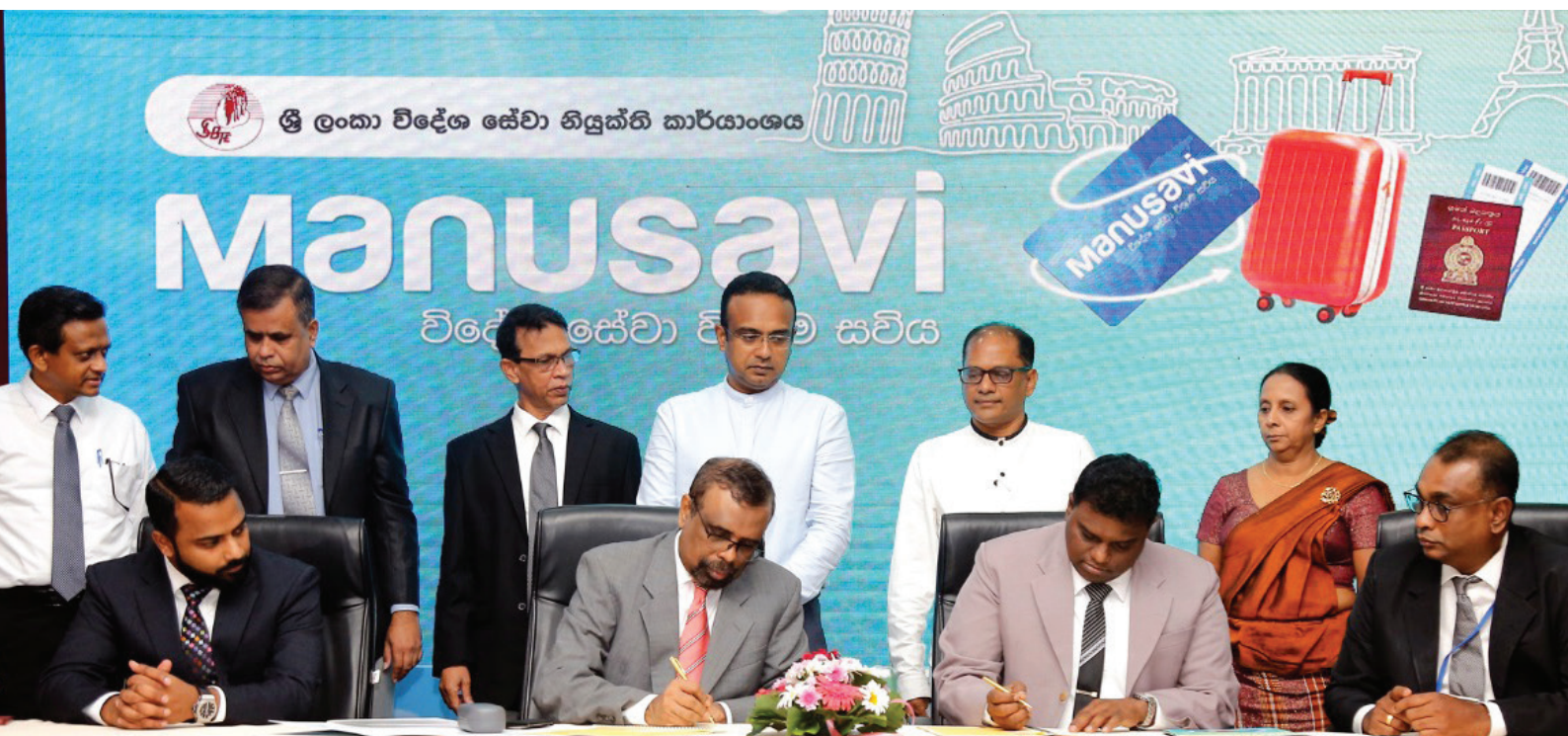
புகைப்படங்களின் 5.1 புலம்பெயர்ந்த தொழிலாளர்களுக்கான பங்களிப்பு ஓய்வூதிய திட்டம்